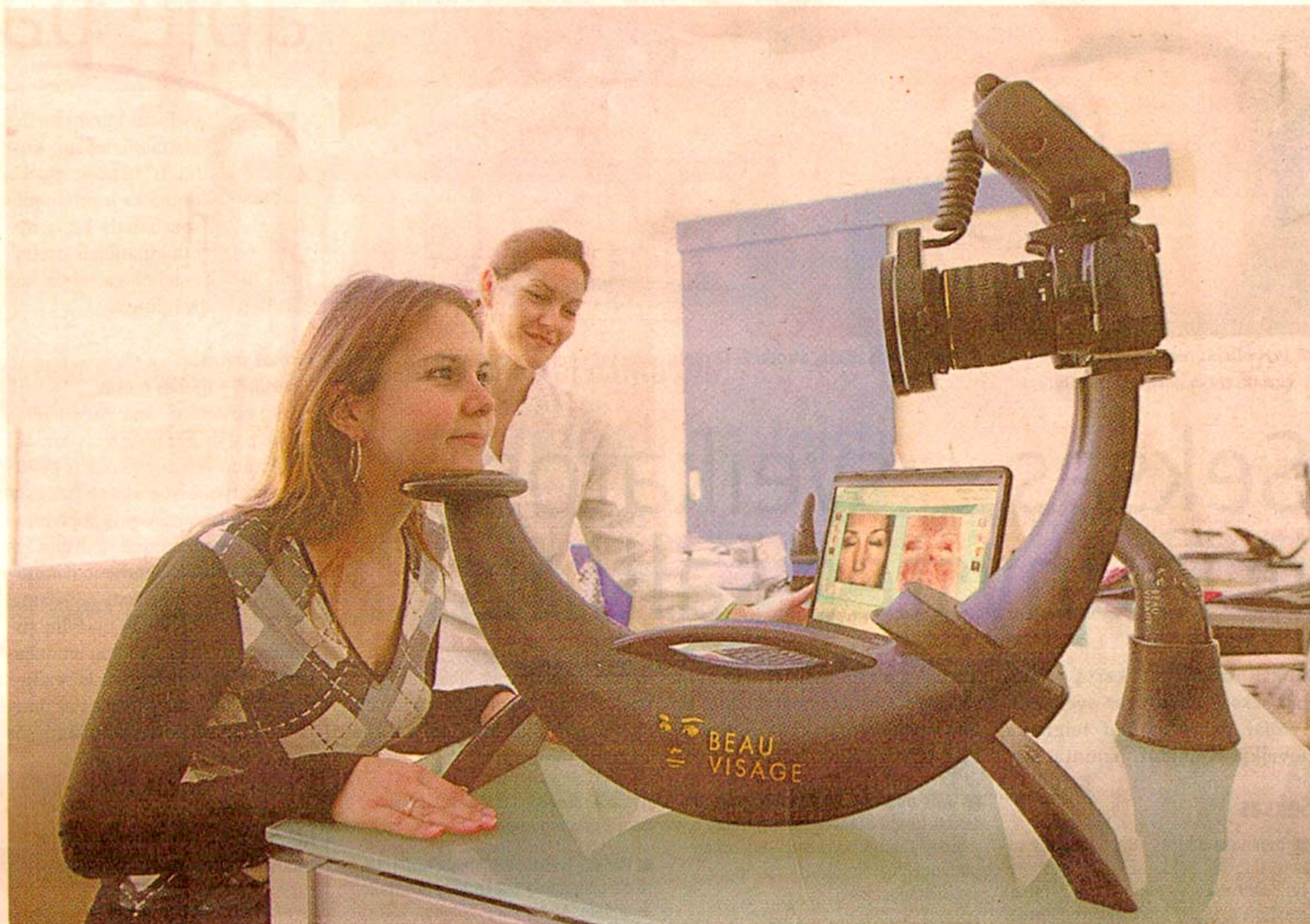
■ Vaidas: tiriant tarsi žemėlapyje atsiskleidžia po oda išsidėsčiusių kraujagyslių tinkleliai, melanino keliai ir nuo deginimosi saulėje likusios žymės.

Įvertinęs odos tipą, jos biologinį amžių, saulės spindulių pažeidimo laipsnį, kolageno išretėjimo laipsnį, melanino kiekį, kraujotaką ir raukšlių išsidėstymą bei jų gylį specialistas gali numatyti ir odos pokyčių ateityje seką: ar greitai ji praras jaunatvišką žavesį, kur įsireš raukšlės, kuri odos vieta greičiausiai prararas stangrumą. Pagal tyrimo rezultatus galima skirti tinkamiausią gydymą ar rekomenduoti odos priežiūros priemones.